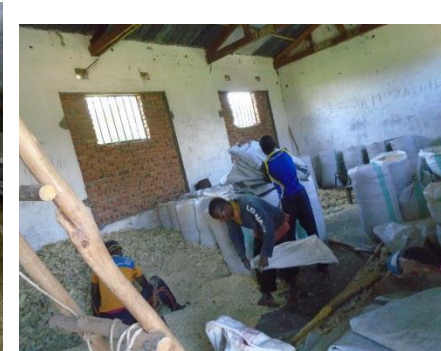
Pesage et emballage de maïs.