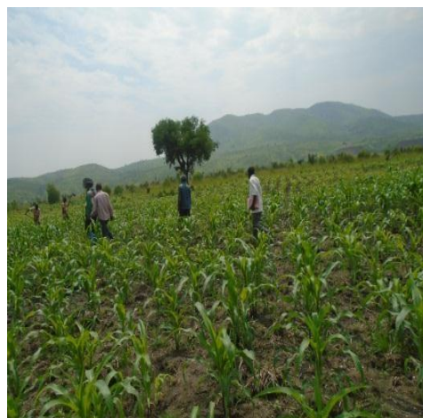
Le champ de maïs à 1 mois.