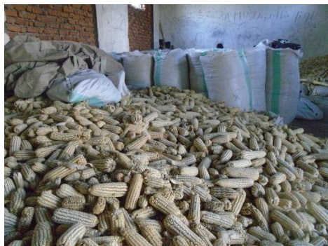
Le maïs dans le dépôt