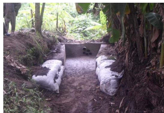
Ces 4 photos illustrent l'évolution des travaux de réhabilitation du canal d'irrigation au Centre d'Encadrement des Paysans de Kiroche (CEPK) effectué par IHD.