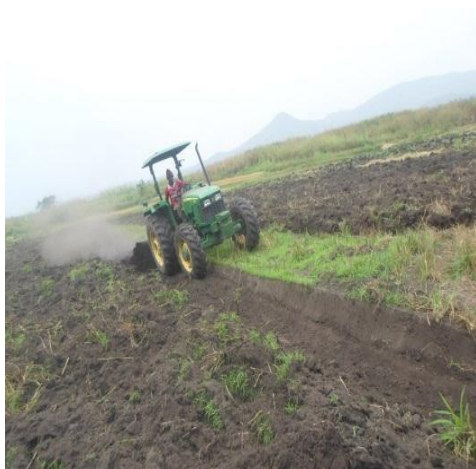
Le Tracteur IHD labourant le champ.