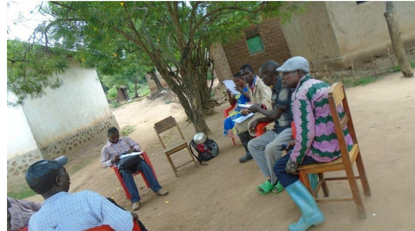
Travaux en carrefour lors de la formation des membres à Kiroche.