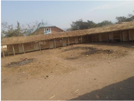
Photo n° 1, 2, 3 : Début de travaux de la construction de la porcherie de Shasha et de Kiroche. Photo n° 4, 5, 6, 7, 8 : Peuplement des porcheries de Shasha et de Kiroche.