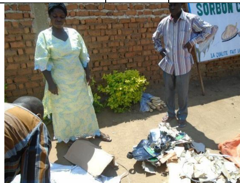
Ces 2 photos montrent la remise des outils aratoires aux responsables des organisations à la base.