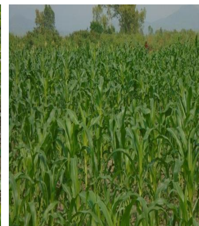
Le champ de maïs à 3 mois.