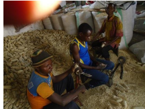
Les journaliers égraineurs.