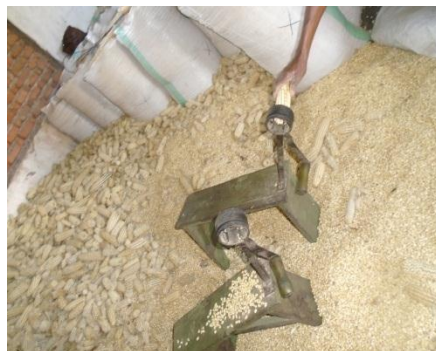
Les maïs en train d'être égrainés.